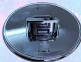
(塗装オプション) クロムメッキ