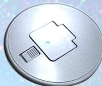
クローズイメージ シルバー・クリア塗装