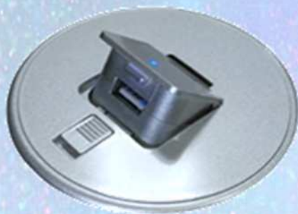
オープンイメージ シルバー・クリア塗装

(特許申請中 iOS系/Android系の携帯端末、及び、加熱式・電子たばこの高速充電対応。)